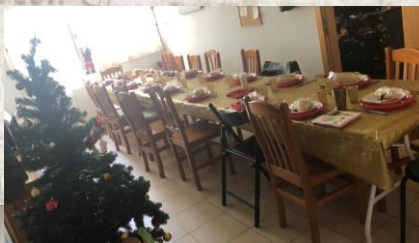
La Fundación "La Liga" vertiente social corporativa de la Liga de Fútbol Profesional, financió las comidas y cenas de los días festivos de final del año 2019, para los centros residenciales de personas adultas de la Fundación.