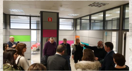
Inauguración de las instalaciones en Gijón del Programa Recielle, de Proyecto Hombre, para atención a menores y familias.