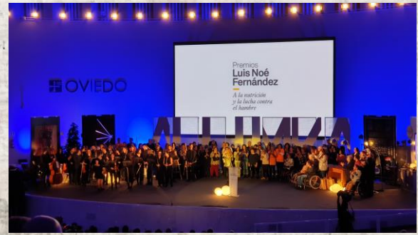
Entrega de X Premios Luis Noé Fernández, de Fundación Alimerka, en Oviedo. Estuvimos presentes las entidades que recibimos apoyos de la Fundación, en alimentos.