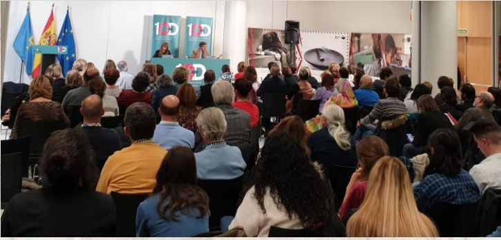
Conferencia de Sami Nair, sobre "Migración y Derechos Humanos", en el Palacio de Congresos, Oviedo.