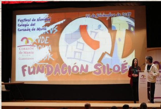
Festival de Fin de Año del Colegio Corazón de María de Gijón, organizado por las/os alumnas/os, y en beneficio de la Fundación Siloé.